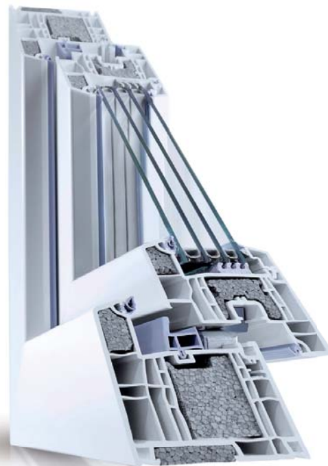
Najúspornejšie okno na trhu EKOPROFIL Geneo Future Dizajn 86MD + ocenenie zlatou plaketau veľtrhu Coneco 2013.